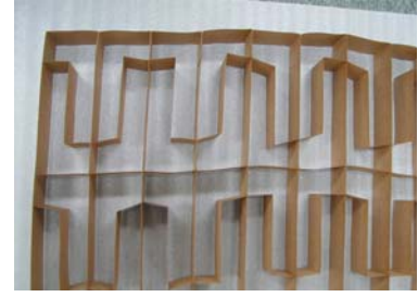
ラーメンの器のマーク？迷路？

掲載内容について詳しくお知りになりたい方はお気軽に弊社営業部までお問い合わせ下さい。